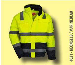
4021 - NEONGELB / MARINEBLAU