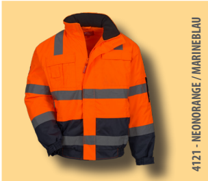
4121 - NEONORANGE / MARINEBLAU